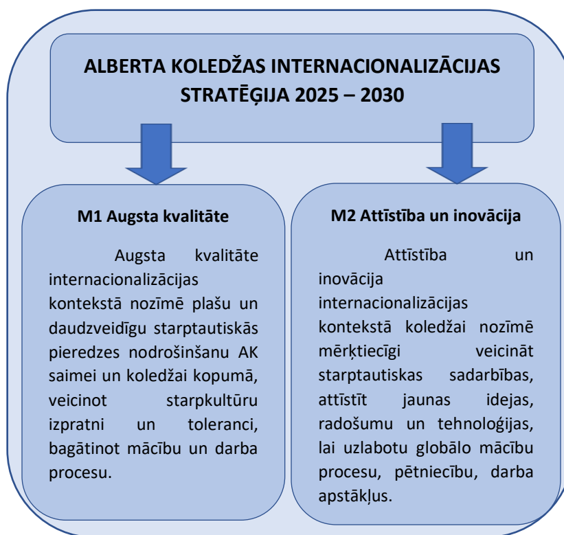
1. att. AK mērķi internacionalizācijas kontekstā

Balstoties uz Alberta koledžas stratēģiju 2025. – 2030. gadam, Internacionalizācijas attīstībai nākamajam attīstības periodam tiek izvirzīti divi galvenie mērķi – M1 augsta kvalitāte un M2 attīstība un inovācijas (1.att.).