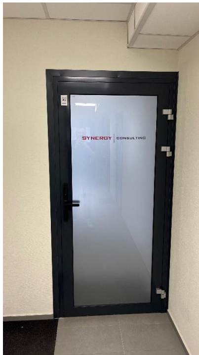
“Synergy Consulting” birojs Viļņā, Laisves avēnijā 78B.