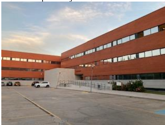
7.att. Internacionālais mūžizglītības departaments.

Erasmus+ pieredze sniedz iespēju ne tikai dalīties pieredzē, bet pastāvīgi gūt informāciju par aktualitātēm nozarē. Novēlu visiem kolēģiem vismaz vienu reizi izvēlēties sev interesējošu galamērķi un ļauties profesionālam piedzīvojumam!