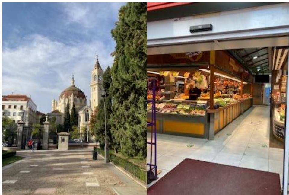
5.att. Iepazīstot sadzīvi Madridē. Skats uz Royal Palace of Madrid un senākais tirgus Madridē.

Erasmus + mobilitātē granta apjomu nosaka attālums un mobilitātē pavadīto dienu skaits. Kas nozīmē, ka jau pirms brauciena ir zināma granta summa, ļaujot izvēlēties sev vēlamāko avioreisu, naktsmītni u.t.t. Mācības Madridē norisinājās 12 km attālumā no pilsētas centra. Izvērtējot sabiedriskā transporta tīklojumu, patērējamo laiku ceļā no-uz mācībām, naktsmītņu cenas pilsētas centrā, lēmu par labu neierastai rīcībai: dzīvesvietu izvēlēties ārpus centra (zemākas izmaksas), bet sabiedriskā transporta vietā, lai nav jāveic vairākkārtēja pārsēšanās, izvēlējos īrētu automašīnu (dienas maksa līdzvērtīga summai, kas tiktu izlietota sabiedriskā transporta biļetēm).