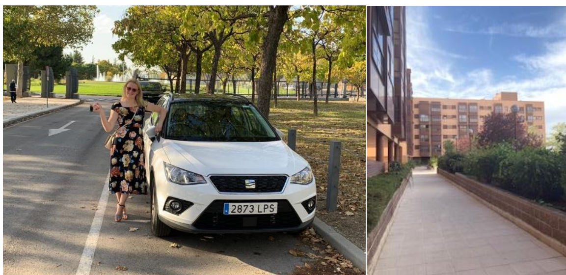
6.att. Risinot sadzīviskus jautājumus- mājvietas un transportlīdzekļa izvēles veikšana.

Erasmus + mobilitātē granta apjomu nosaka attālums un mobilitātē pavadīto dienu skaits. Kas nozīmē, ka jau pirms brauciena ir zināma granta summa, ļaujot izvēlēties sev vēlamāko avioreisu, naktsmītni u.t.t. Mācības Madridē norisinājās 12 km attālumā no pilsētas centra. Izvērtējot sabiedriskā transporta tīklojumu, patērējamo laiku ceļā no-uz mācībām, naktsmītņu cenas pilsētas centrā, lēmu par labu neierastai rīcībai: dzīvesvietu izvēlēties ārpus centra (zemākas izmaksas), bet sabiedriskā transporta vietā, lai nav jāveic vairākkārtēja pārsēšanās, izvēlējos īrētu automašīnu (dienas maksa līdzvērtīga summai, kas tiktu izlietota sabiedriskā transporta biļetēm).