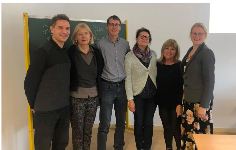
1.att. Mācību dalībnieki. Spānija, Madride. 2022.gada 17.-21.oktobris.

Ir ierasts, ka atsevišķi tiek runāts par mācīšanas un mācīšanās tehnikām, retāk par to mijiedarbību un līdzsvarotu izmantošanu. Vēlme padziļināti pētīt mācīšanas un mācīšanās tehnikas noteica izvēli doties Erasmus + pieredzes apmaiņas mobilitātē uz Spāniju, Madridi.