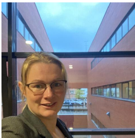
3.att. Uzņemošās universitātes ēka

Nereti mācībspēki izvairās doties Erasmus+ mobilitātēs, jo nejūtas droši par angļu valodas zināšanām un prasmēm. Atbilstoši savai pieredzei kolēģus vēlos iedrošināt- internacionālā vidē angļu valodas temps ir lēnāks, valoda vienkāršāka, kā rezultātā nerodas sarežģījumi ar komunikāciju. Erasmus+ dalībniekus vieno kopīgs mērķis- izglītības kvalitātes celšana.