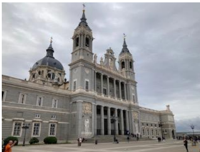
4.att. Almudena Cathedral

Piesakoties mobilitātei, formalitātes palīdzēja sakārtot Alberta koledžas Erasmus koordinatore, kā rezultātā nebija jāsatraucas par dokumentācijas procesu- katrs veicamais solis tika izskaidrots. Arī uzņemošajai institūcijai bija pieredze Erasmus realizācijā, tādēļ dokumentu apmaiņa notika raiti. Jau pirms ierašanās Spānijā bija zināms nodarbību plāns un katras dienas mācību tēmas, izstrādājami projekti, kas deva iespēju ieplānot arī brīvo laiku, lai iepazītos ar Spānijas kultūru, arhitektūru, pilsētvidi u.tt. Pirmajā mācību dienā viesmīlīgi tika pasniegti tradicionālie Spānijas suvenīri, kas raisīja savstarpējo saskarsmi, radot pozitīvu vidi mācībām.