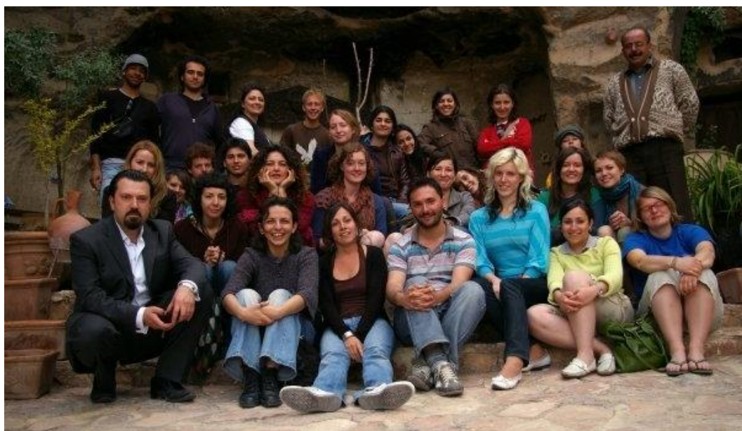
Eiropas brīvprātīgais darbs Turcijā 2008.gadā

Erasmus mobilitātes ietvaros izgāju apvienoto studiju un kvalifikācijas praksi Somijas Startup tehnoloģiju uzņēmumā Tira , kas ir izstrādājis darbvirsmas vietni un sevi apvieno uzdevumu pārvaldības, tērzēšanas programmu un kalendāru. Prakses vakanci atradu erasmusintern.org mājas lapā. Aplūkojot kompānijas karjeras lapu, mani uzreiz uzrunāja